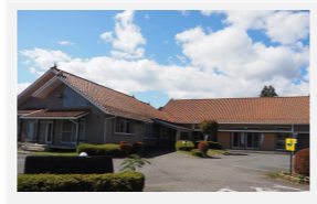
久保コミュニティセンター 南箕輪村951-1