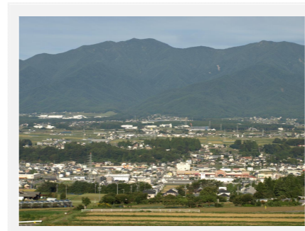
河岸段丘に広がる久保区と遠くの経ヶ岳