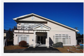
中込公民館 南箕輪村724-138