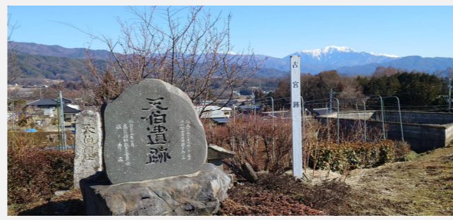
天伯遺跡から望む仙丈ヶ岳