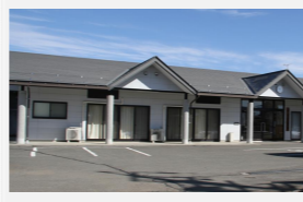
塩ノ井公民館 南箕輪村606