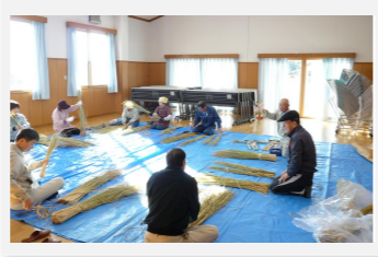
しめ縄作り講習会