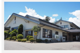
北殿公民館 南箕輪村3163-2