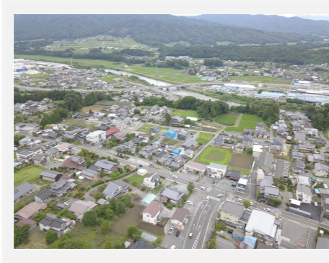
北殿区上空からの風景