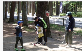
マレットゴルフ大会