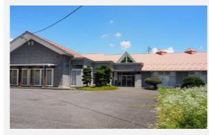
南殿コミュニティセンター 南箕輪村4861-2