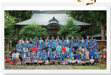
殿村八幡宮例大祭