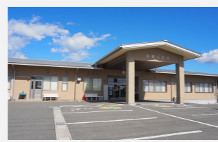
田畑公民館 南箕輪村6627