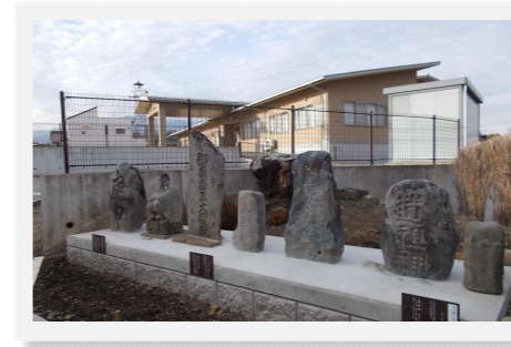
石仏群から見た公民館