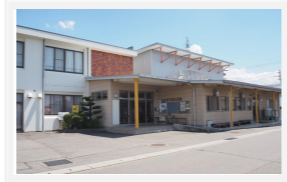
神子柴公民館 南箕輪村7288