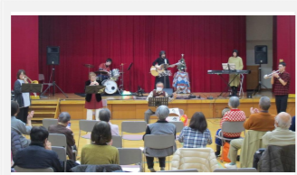
クリスマスコンサート

新一年生の入学を祝う会、義務教育終了を祝う会や地区サロン、社会見学、クリスマスコンサートなど、子どもから高齢者まで参加できるイベントを開催しています。