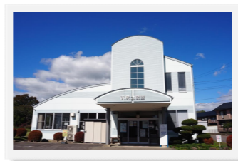
沢尻コミュニティセンター 南箕輪村9475-1