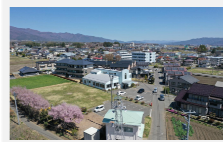
上空からみた沢尻