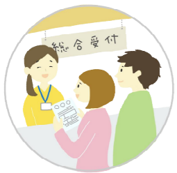
役場で 転入手続き