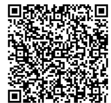
沢尻区の詳しい地図はこちら