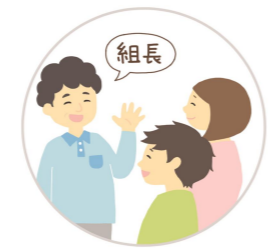
組長が転入者の自宅へ 訪問