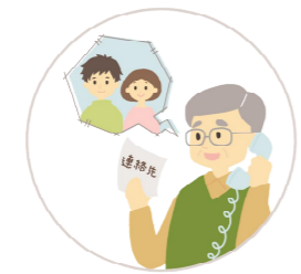
区長から転入者へ 電話