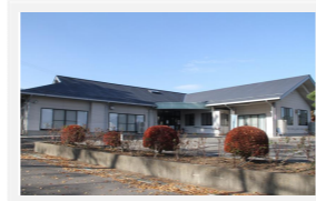
南原コミュニティセンター 南箕輪村9648-8