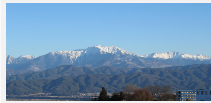
南原から見た南アルプスの山々