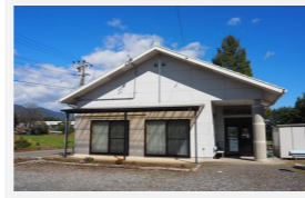
大芝公民館 南箕輪村2380-271