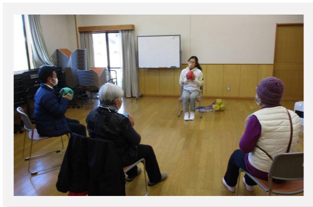
げんきあっぷクラブ

開催日や詳しい内容のお問合せは、南箕輪村社会福祉協議会デイサービス松寿荘76-8786までお電話ください。