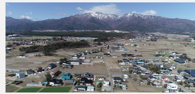
大泉区上空からの風景