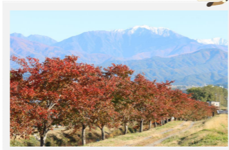
大泉川桜並木の紅葉と仙丈ヶ岳