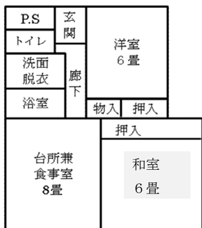
※ 参考間取り図 6畳タイプ