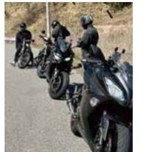
趣味が合う仲間同士でツーリングを楽しんでいる様子

消防団は普段はさまざまな仕事を持った人が参加していて、年齢も20代~50代まで幅広い世代の団員がいます。仕事、家族、その他にもう一つのコミュニティを消防団で作りませんか? 普段の生活では出会わない人たちとの楽しい交流もできます。