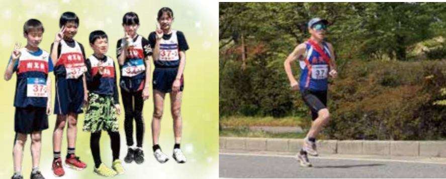
選手の皆さんそれぞれが素晴らしい走りを見せてくれました。