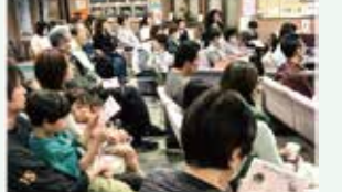
ロビーは入口側まで満席状態

今月のイベント 村の史跡(2日)、すくすく玉手箱(3日)、 ズンバ、野鳥座学(4日)、野鳥・植物観察(7日)、 中国語(9.23日)、笑い文字(10日)、 経ヶ岳道づくり(13日)、女性の健康とケア(17日)、 ゆずり葉学級(18日)、大人クラフト、父の日講座(20日)、 韓国語(24日)、箏(25日)、経ヶ岳登山(27日)