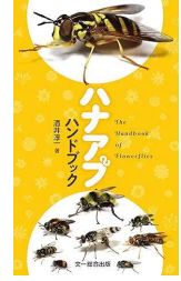
『ハナアブハンドブック』 酒井 淳一/著 文一総合出版 (486・サ)