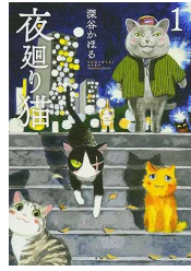
『夜廻り猫 1～12』 深谷 かほる/著 講談社 (コミック726・フ)