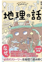
『面白すぎる地理の話』 瀧波 一誠/著 産業編集センター (290・タ)