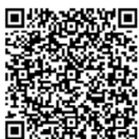
村公式ウェブサイト 職員採用情報

※ 受験の案内は受験票に記載していますので、村からは改めて通知を行いません。プロフィール等に不明な点がある場合は、村からメールまたは電話で連絡することがあります。