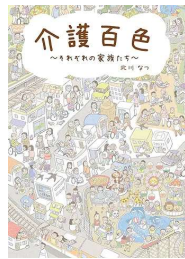
『介護百色』 北川 なつ/著 アルタ出版 (369・キ)