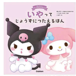
『おしえて! サンリオキャラクターズ シリーズ いやってじょうずにつた えるほん』 Gakken (絵本(オ))