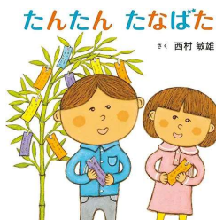
『たんたんたなばた』 作：西村 敏雄 白泉社 (絵本・タ)