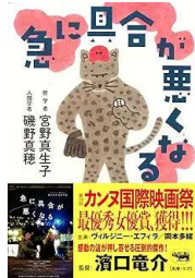
『急に具合が悪くなる』 宮野 真生子/他 晶文社 (916・ミ)