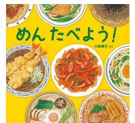
『めんたべよう!』 小西英子 福音館書店

※こちらのコーナーで、おすすめ本や絵本にまつわるエピソードを紹介してくださる方を募集しています。職員にお気軽にお声がけください。