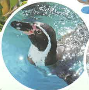
ファンボルトペンギン