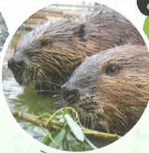
アメリカビーバー