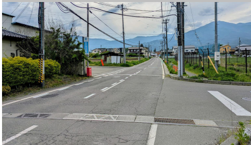
再②9. 南原|村道8号線 赤羽アート前