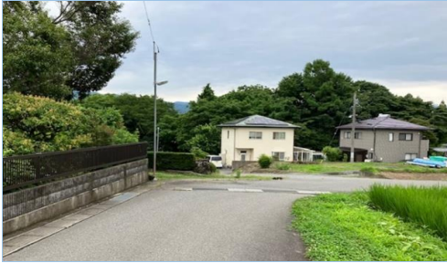
35. 南殿|村道1205号線 JA南箕輪支所東