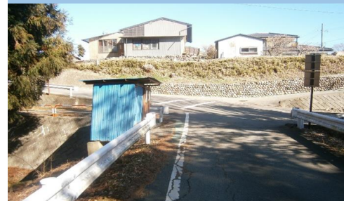
7. 塩ノ井|ゴミステーション前坂道