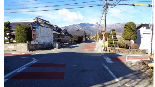
④0. 大泉|県道吹上北殿線、村道3058号線交差点