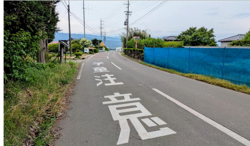
42. 北原|久保・北原信号西 西天竜手前交差点