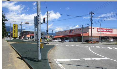
56. 神子柴|ニシザワ信大前付近