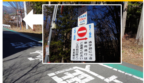
再46.-1 南原|村道2217号線 平野マルチ西