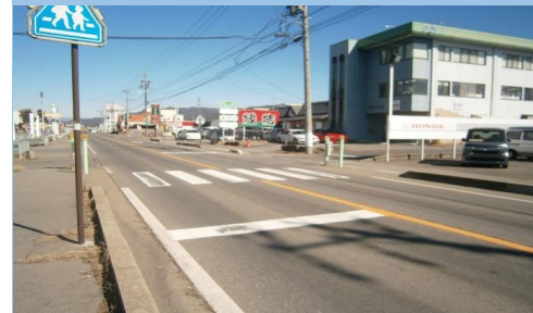
4. 久保|国道153号 ホンダ自動車前