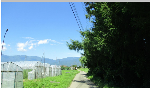
54-2. 神子柴|村道 7 号線