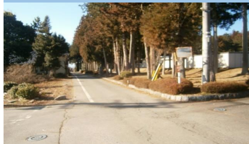
16. 南殿|村道2060号線 役場東通学路