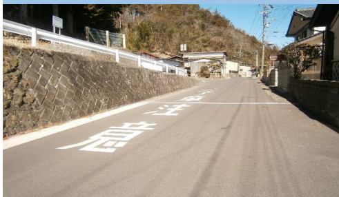
5. 塩ノ井|村道1063号線 青の坂と旧道合流点