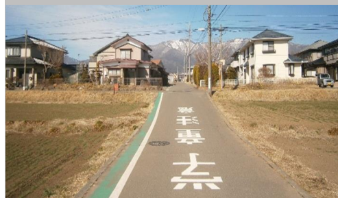
21. 北殿|村道1148号線 中込線通学路