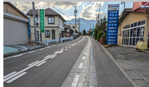
旧33. 北殿|村道5号線 中学校前歩道