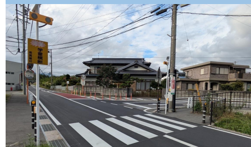
再22. 沢尻|南林ハイツ前変則交差点