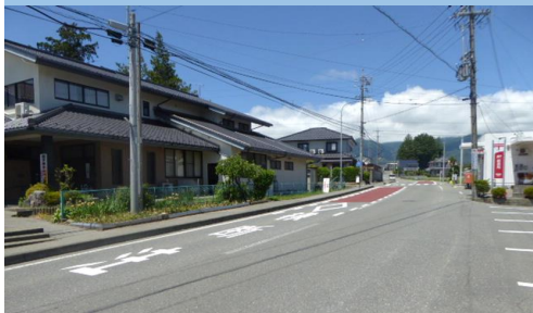
11. 北殿|県道吹上線 郵便局前