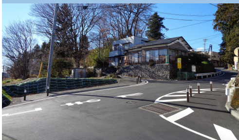
⑫(3). 北殿|北殿駅前かどやクリーニング西南坂道