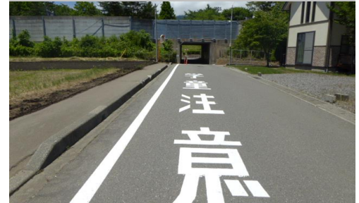
37. 沢尻|村道2191号線 南部小学校東付近