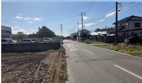
20. 田畑|県道伊那北殿線 浄化センター前