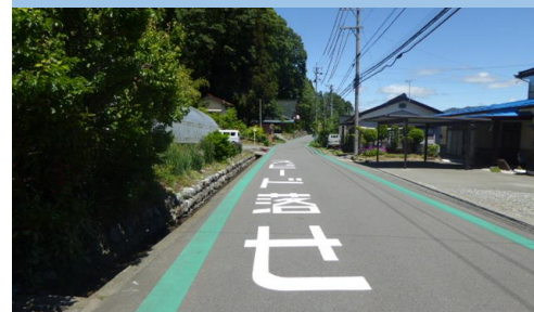
14. 久保|村道1063号線 北部保育園西付近