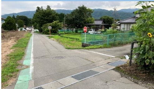
32. 北殿|村道1133号線 郵便局北通学路