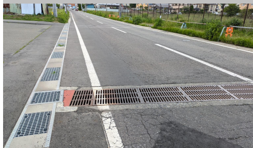
旧34. 南原|村道8号線 中央道から西側