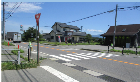
55. 南原|村道 8 号線(9666番地1付近)