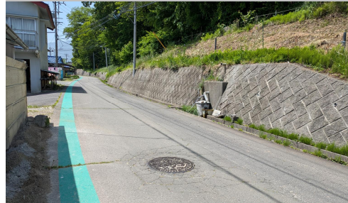
28. 南殿|村道1199号線 南田橋北側道路