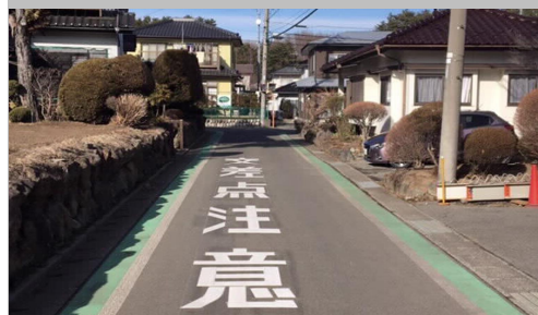
24. 南原|村道2220号線 南原T字路