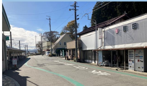
⑫(1). 北殿|北殿駅前西道路