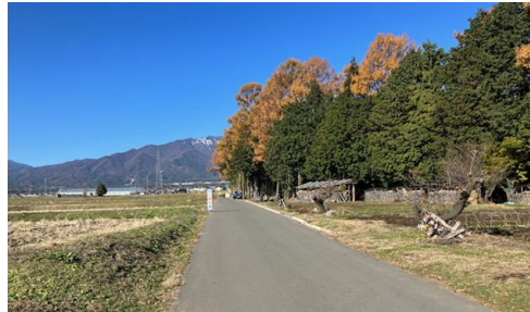
39. 塩ノ井|村道4号線中込線～村道1126号線