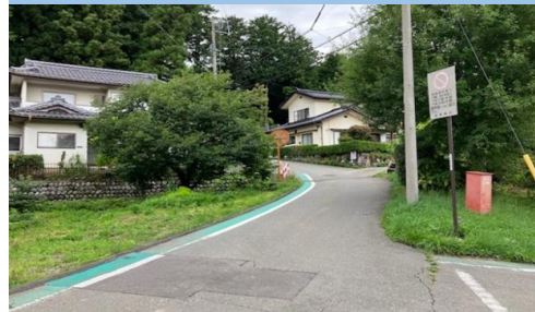
31. 北殿|村道1143号線 新四国霊場付近