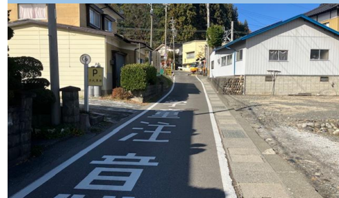
⑫(2). 北殿|北殿駅南踏切付近