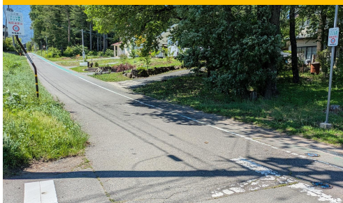
再46.-2 南原|村道2217号線 平野マルチ西