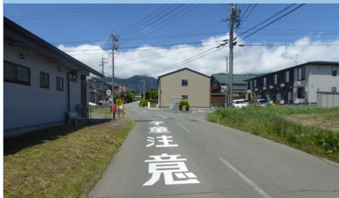
3-1. 北原|北原公民館北西2箇所