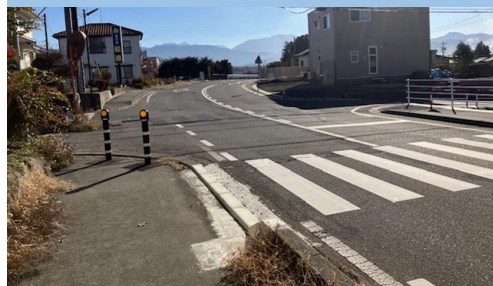
⑨. 北殿|県道吹上北殿線 中部保育園前