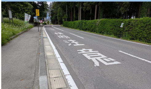
18. 南殿|村道105号線 役場庁舎南側道路