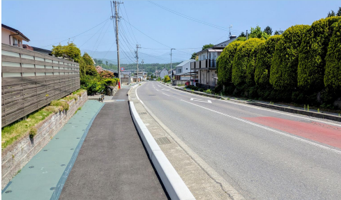
38. 田畑|村道3号線 マツミガラス東