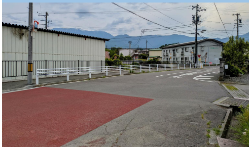
再44. 沢尻|村道10号線 上農石碑前の五差路