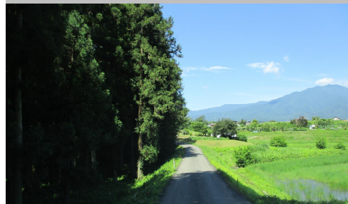
54-1. 神子柴|村道 7 号線