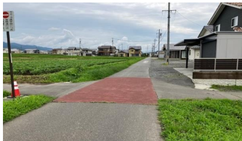
33. 北殿|村道1178号線・1189号線交差点