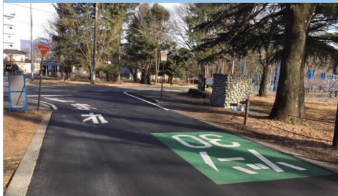
26. 神子柴|信大前東道路横断歩道