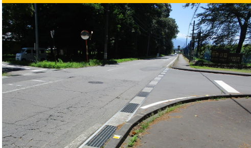
再49. 神子柴|信州大学正門前横断