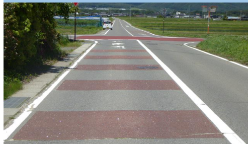
6. 塩ノ井|村道4号線中込線交差点