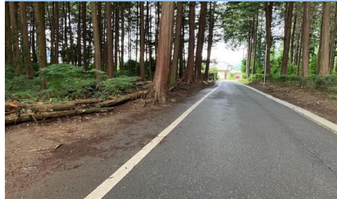
36. 南殿|村道2060号線 八幡森東付近