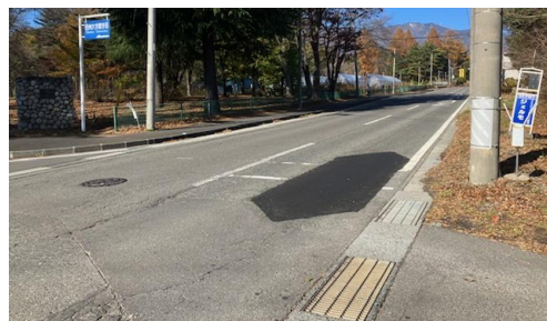
⑤0. 神子柴|信州大学バス停付近横断