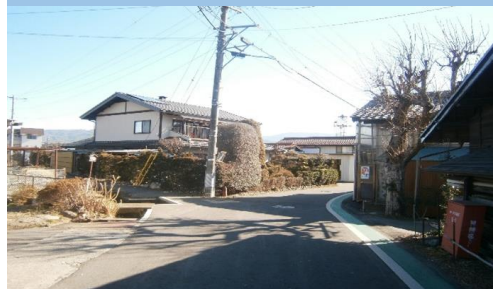
19-1. 田畑|信号機西北通学路